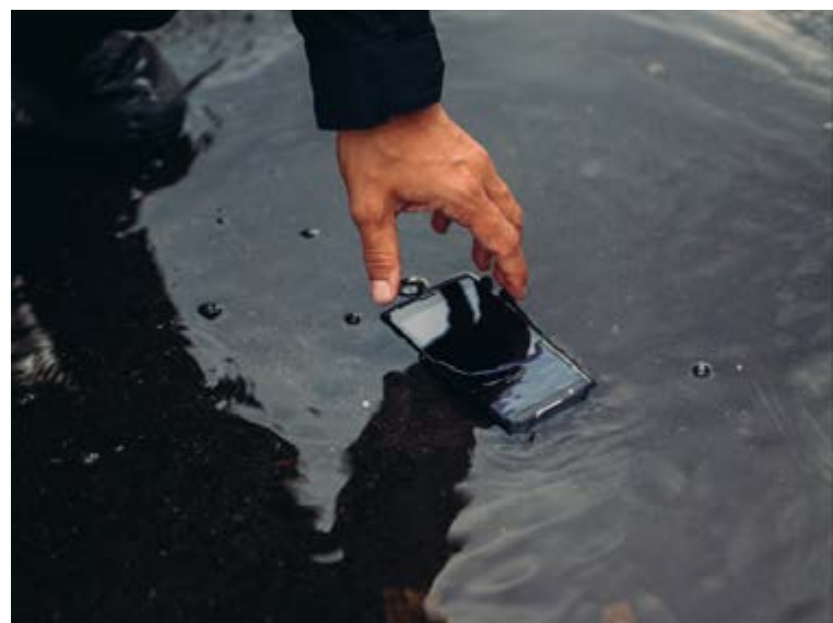
Témoignage des Membres des forces d'intervention du Ministère de l'Intérieur

« Le côté sport extrême de Crosscall a toujours été important pour eux et c'est aussi important pour nous dans le sens où il y a des analogies dans les deux métiers. »